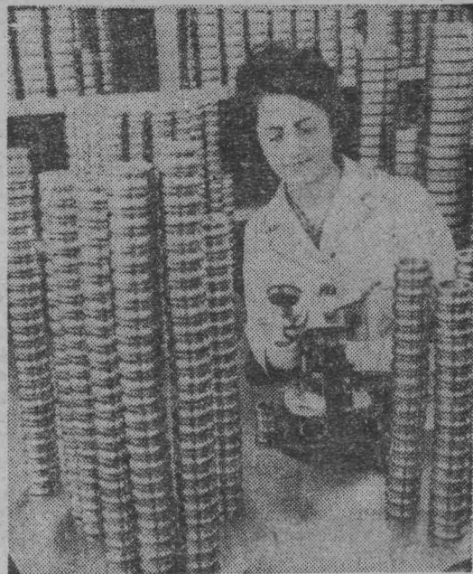
Социалистическая Республика Румыния. Продукция Бырладского подшипникового завода экспортируется более чем в 30 стран. На снимке: сортировка деталей подшипников.