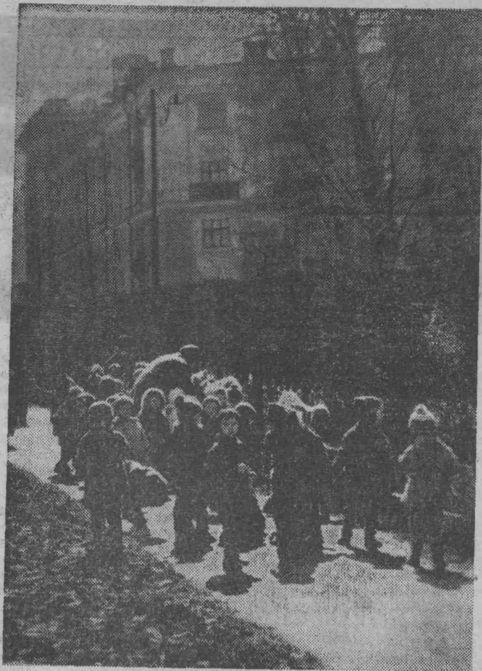
Фото и текст В. Данникова.

Шутки, улыбки и веселый смех, и все это — Весна!