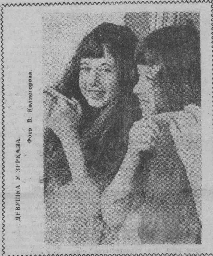
ДЕВУШКА У ЗЕРКАЛА

Жалобщик возмутился и сказал: «Сидит здесь, выпучил глаза». Он попал в больное место кассира, так как она действительно страдает этим недостатком, и она его обозвала идиотом.