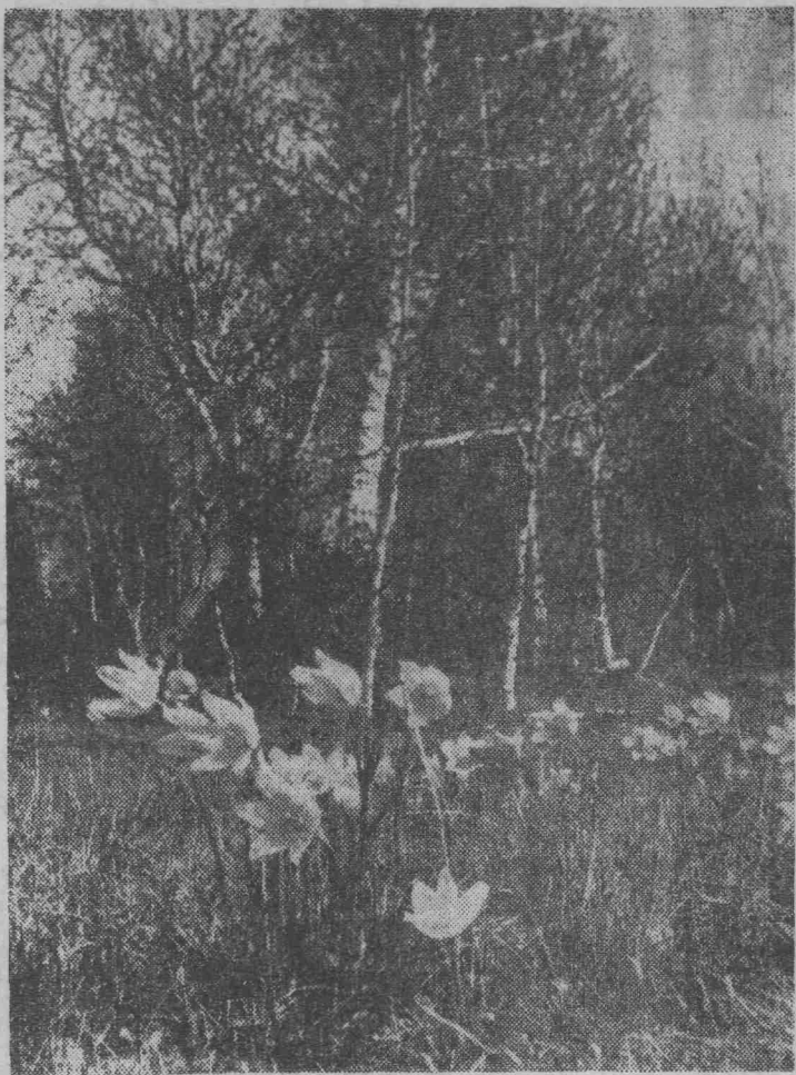
НА СОЛНЕЧНОЙ ПОЛЯНОЧКЕ