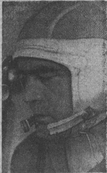
Командир космического корабля «Союз-9» А. Г. Николаев.