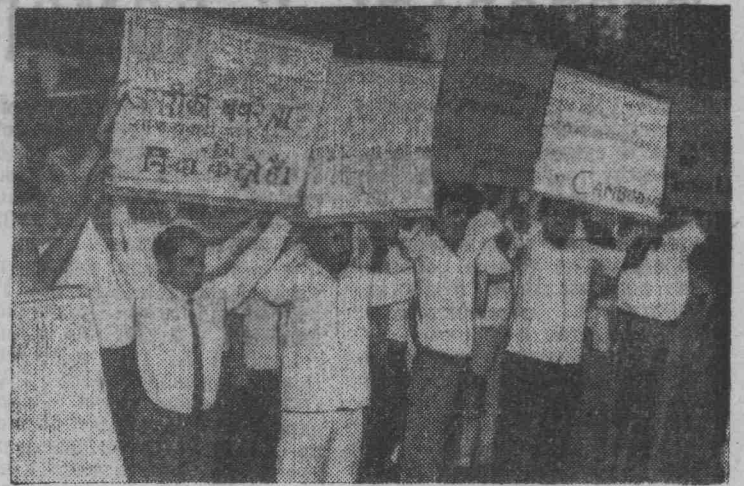
Общественность Индии решительно осуждает агрессию американско-сайгонской военизированной в Камбодже. Во многих городах страны проходят мощные демонстрации протеста против вмешательства США во внутренние дела камбоджийцев.

На снимке: преподаватели вузов и школ Дели протестуют против американской агрессии.