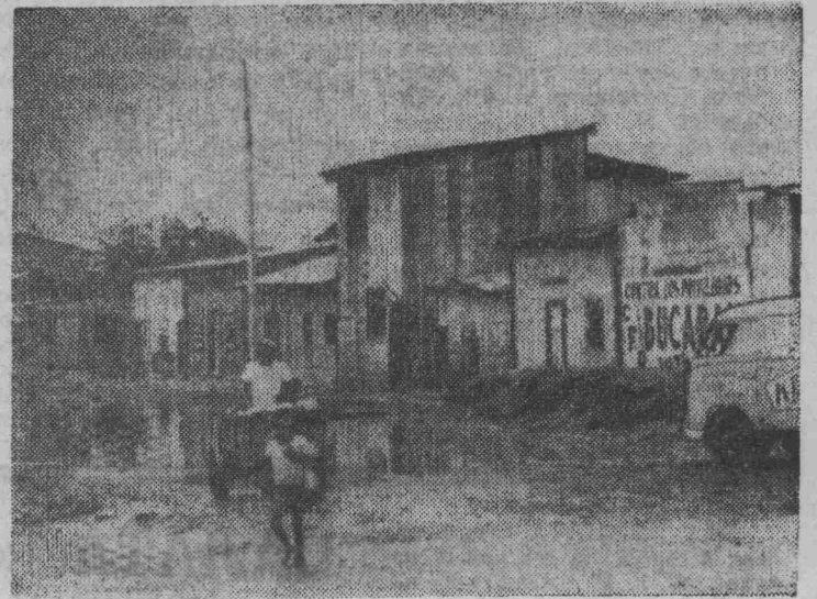
В Эквадоре все острее ощущается нехватка жилищ. Более половины населения Гуаякиля — крупнейшего города страны — живет в крайне тяжелых антисанитарных условиях, которые усугубляются в период дождей.

На снимке: на одной из улиц, где живет рабочая беднота.