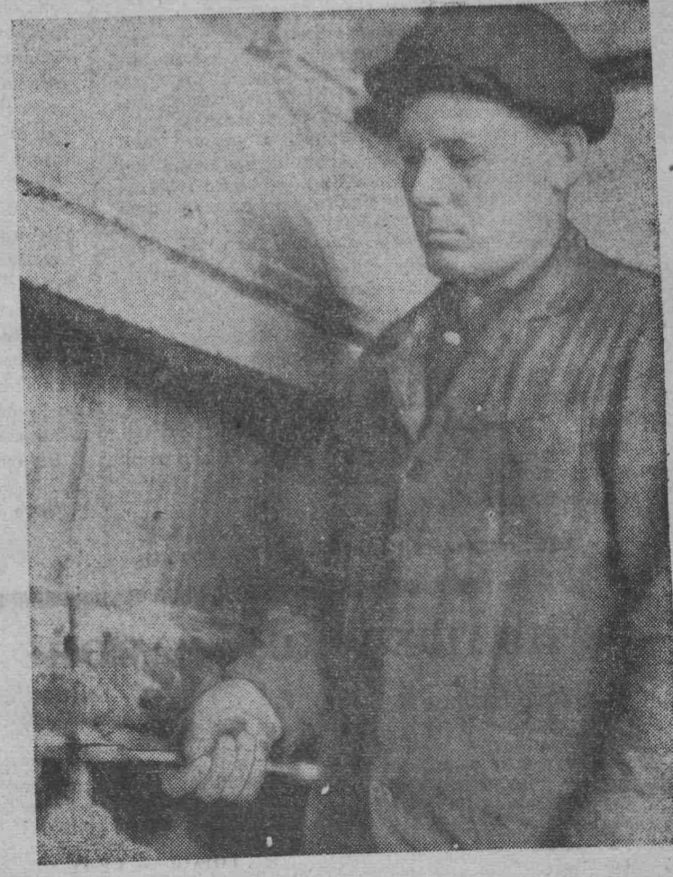
Фото и текст Н. Достовалова .