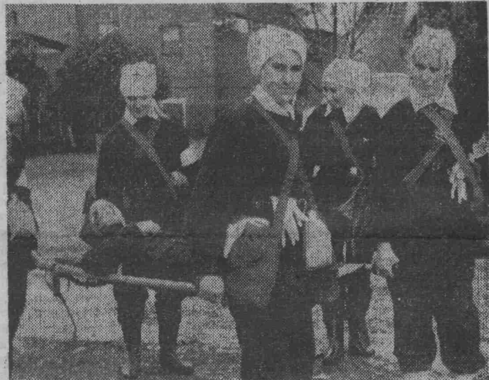
Санитарная дружина оказывает помощь пострадавшим.

Н. СМЕТАНИН, начальник штаба ГО шахты имени Ярославского, майор запаса.