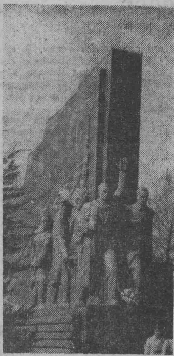
ТАШКЕНТ. Памятник ташкентским комиссарам.