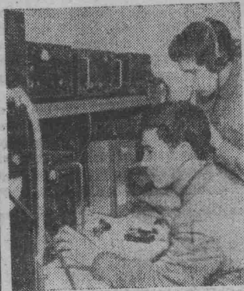
Самодельному, спортивно-техническому радиотелевизионному клубу ДОСААФ Ташкентского авиационного завода имени Чкалова — всего пять лет.