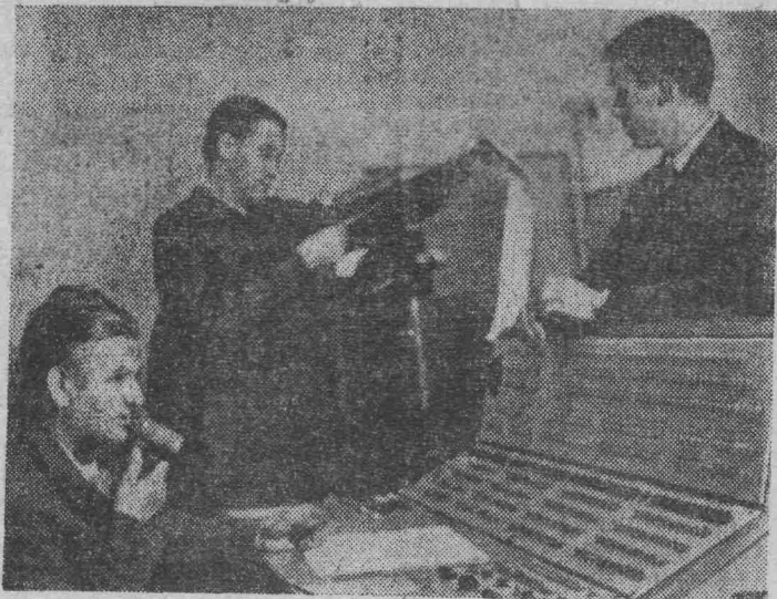
МОСКВА. Электронно-вычислительная машина «БЭСМ-3М», пульт управления которой вы видите на снимке, ничем не отличается от своих «сестер». И, тем не менее, при работе с ней в ряде случаев больше не требуется сложной записи заданий на перфокарты, которые обычно вводятся в ЭВМ. Она снабжена оригинальным устройством для автоматического распознавания звуков речи и слов, которое делает возможным непосредственное общение человека с машиной.