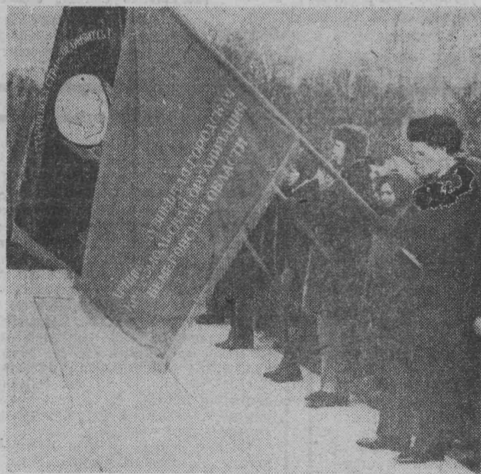
В прошедшую пятницу состоялось торжественное шествие комсомолки города к памятнику героям Мартовского восстания. На снимках: слева — комсомолец чтит память героев; вверху — минута молчания.