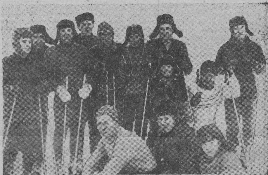
На снимке: группа отдыхающих на лыжной прогулке.