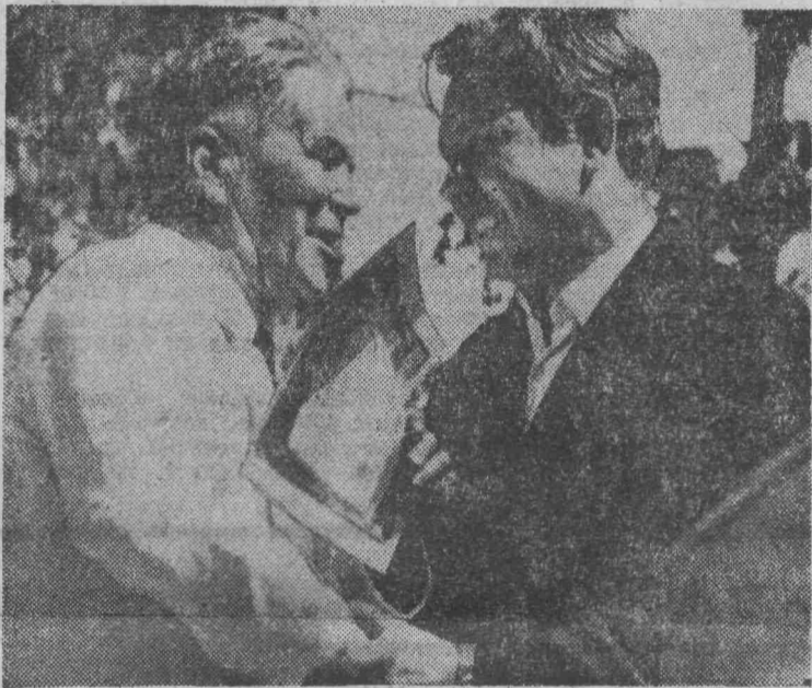
На прошлой неделе, в четверг, ветераны нашего города отмечали свой праздник День пенсионера в парке имени Горького.

— Ремонт дороги на участке от остановки «Комсомолец» до остановки «Заявочная» закончен полностью.