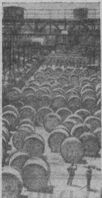
ЮГОСЛАВИЯ. Во многие страны мира экспортируется продукция завода по производству кабеля и проволоки в гор. Светозарево. На снимке: готовая продукция предприятия.