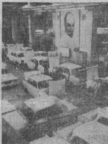
Удмуртская АССР. На Ижевском автомобильном заводе произошло знаменательное событие: с конвейера сошел 50-тысячный «Москвич».

НА ЗАМЕТКУ «Меню для отчета», помещенную в газете № 134 за 8 июля, сообщаем: проверкой установлено, что недостатки в работе пельменной, указанные в заметке, имели место. Причиной неудовлетворения спроса на пельмени явились недокомплект работников кухни в связи с тем, что они направлены работать на летний сезон в пионерские лагеря, а также