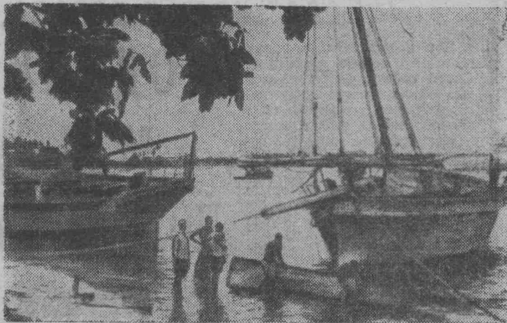
Танзания. Одна из многочисленных бухт Дар-эс-Салама. Отсюда ловцы жемчуга отправляются на промысел.