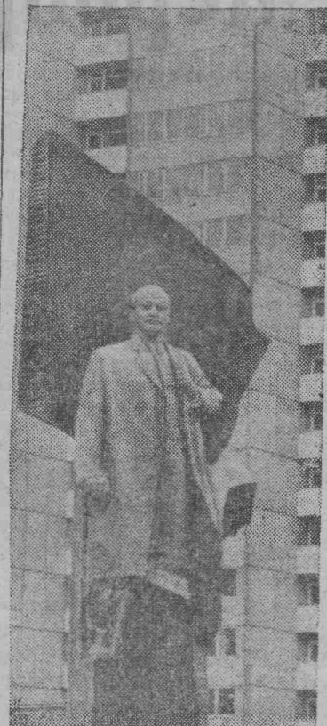
БЕРЛИН. Памятник Владимиру Ильичу Ленину был открыт недавно в столице ГДР. Он сооружен по проекту советского скульптора народного художника СССР Н. В. Томского.

Премьер-министр ДРВ заявил о решимости вьетнамского народа продолжать борьбу на военном, политическом и дипломатическом фронтах до полной победы. (ТАСС).