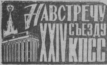
Фото и текст Д. Николаева

В ЧЕСТЬ XXIV съезда КПСС коллектив завода «Кузбассэлемент» взял дополнительные обязательства: выполнить пятилетний план производства товарной продукции к 10 октября 1970 года; изготовить и реализовать дополнительно товарной продукции на 100 тысяч рублей; за счет осуществления