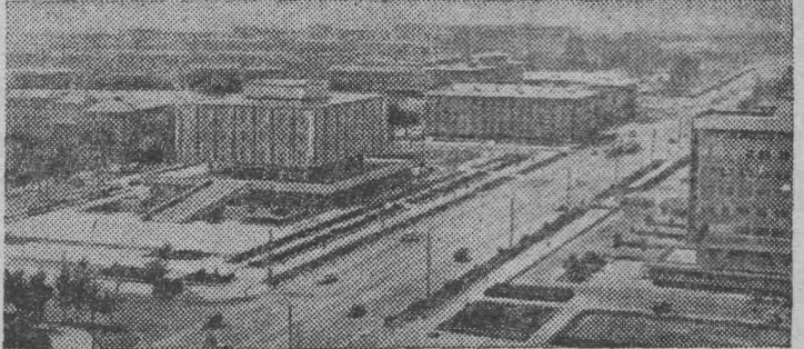
Украшением столицы Узбекистана стал проспект имени В. И. Ленина. Это целый архитектурный комплекс, протянувшийся на четыре километра. Авторы проекта Л. Т. Леонов и Ю. А. Халдеев.