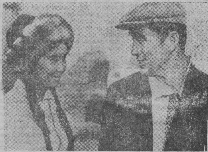
Редактор А. И. ЛАКИСОВ.

ПОТЕРЯЛСЯ БЫЧОК масти мышистой, на лбу белое пятно, возраст 8 месяцев.