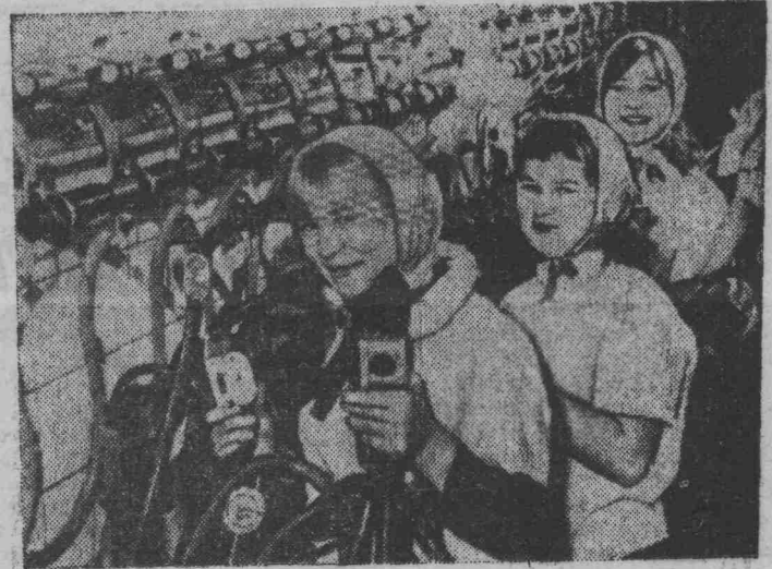
Молодые животноводы народного имения в Эберсбаже-Штокхаузене (ГДР). От каждой из обслуживаемых молодежной бригадой 200 коров за год получено по 5200 килограммов молока.