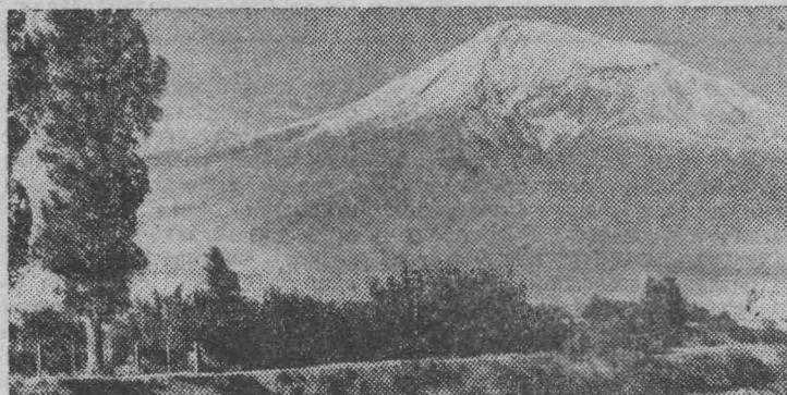
Армянская ССР. В Арагатской долине.