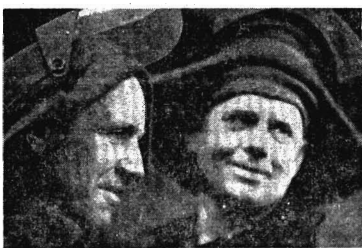
лургического завода. Запсиб в наши дни не зря считают форпостом черной металлургии на востоке страны. Сейчас завод-исполн отплавляет чугун и сталь, прокат и кокс, продукты химии почти в двести адресов

Советского Союза и во многие зарубежные страны.