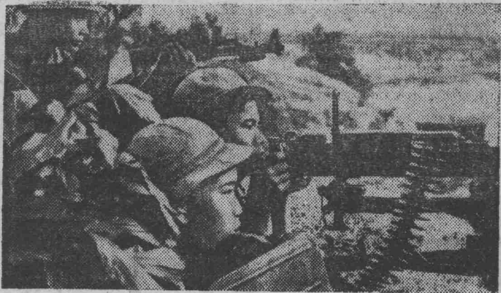
ЮЖНЫЙ ВЬЕТНАМ. Бойцы Народных вооруженных сил освобождения продолжают наносить удары по американско-сайгонскому войску.

На снимке: засада бойцов НВСО вблизи автомагистрали № 9 (провинция Куангчи).