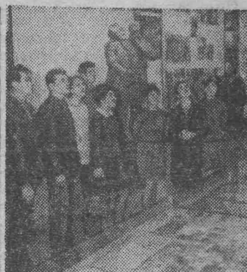
МОСКВА. К 150-летию со дня рождения Фридриха Энгельса, которое исполняется 28 ноября этого года, в музее К. Маркса и Ф. Энгельса создана выставка «Фридрих Энгельс — вождь и учитель международного пролетариата».

На снимке: посетители знакомятся с экспозицией.