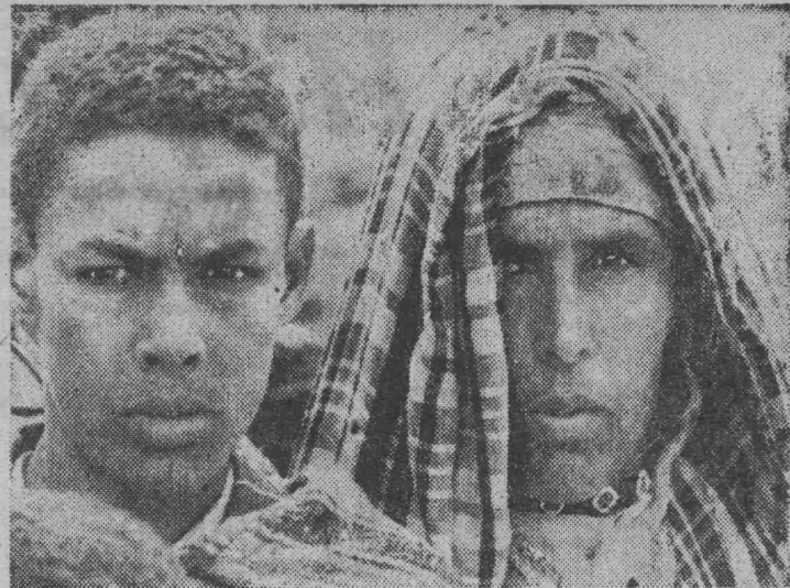
МАРОККО. На снимке: мать и сын.

Ф. ЧЕПКАСОВ , директор кинотеатра «Победа».