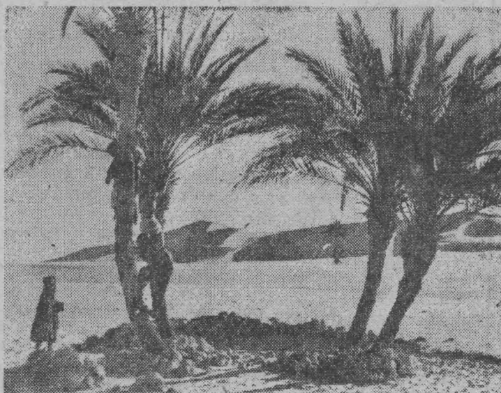
АЛЖИР. Пустыня Сахара в предместьях города Уаргла.