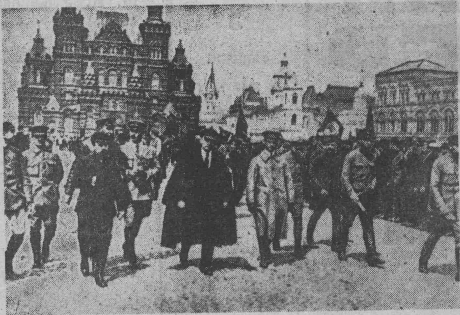
В. И. Ленин с группой командиров обходят фронт войск Всевобуха на Красной площади. Москва, 25 мая 1919 года.