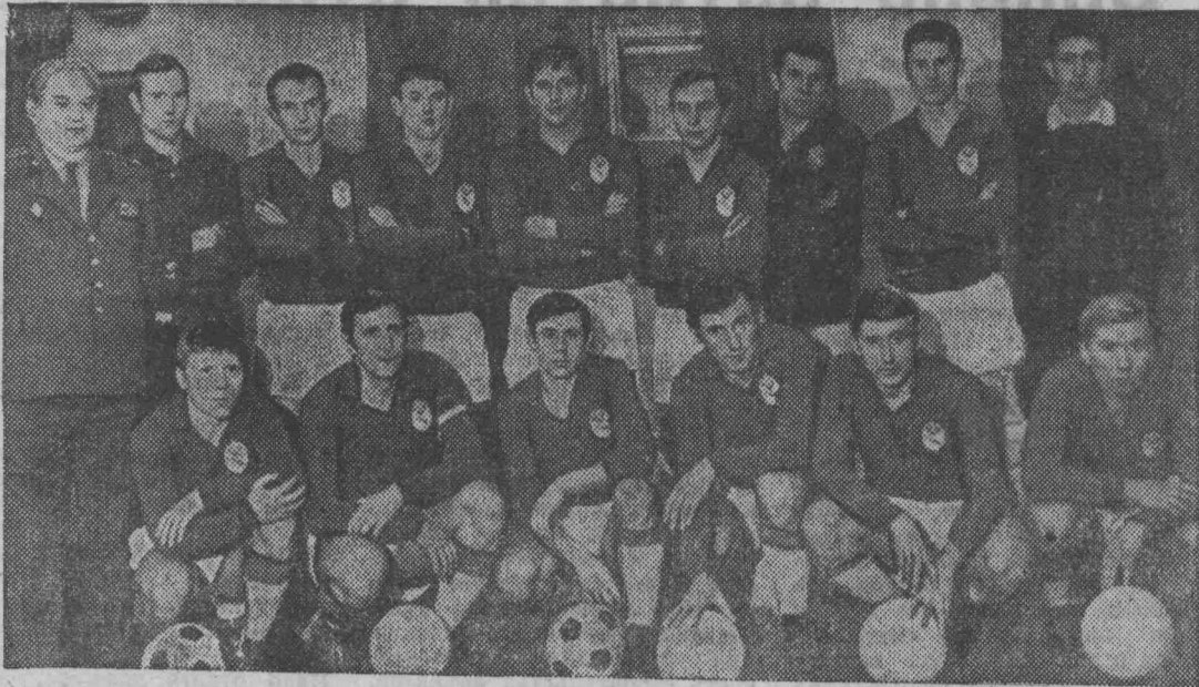
ТАШКЕНТ. Чемпионом СССР по футболу стала команда ЦСКА. 6 декабря во втором дополнительном матче армейцы победили московское «Динамо». Их первый дополнительный матч, который был накануне, закончился вничью (0:0).