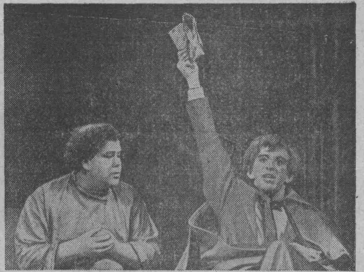
В Московском драматическом театре имени Гоголя состоялась премьера спектакля «Портрет» (сценическая композиция Г. С. Соколова, созданная по одноименной повести Н. В. Гоголя). Постановка — Г. С. Соколова. Художник — П. А. Белов.