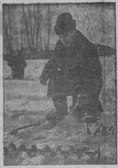
СВЕРДЛОВСКАЯ ОБЛАСТЬ. Вдоль берегов реки Салды в живописном лесу размещился новый «цех» вдовья. Выходные дни рабочие Верхнесалдинского металлургического завода проводят в зоне оздоровительного комплекса.

В. ГАНЕНКО, экономист шахты «Комсомолец».