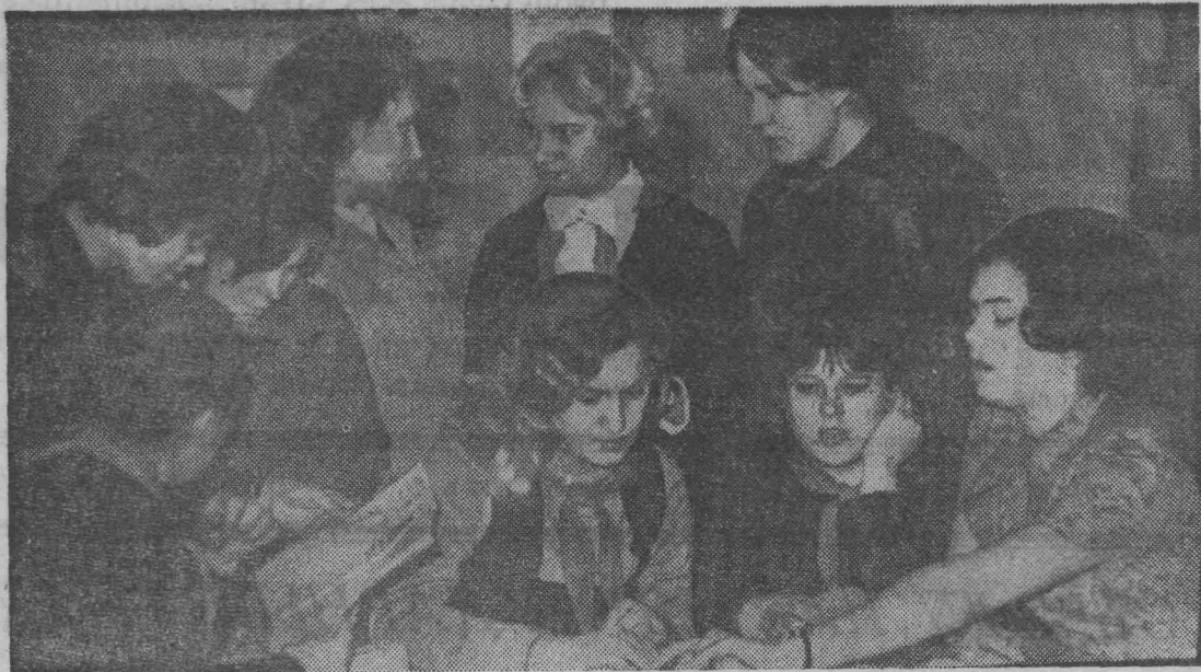
НА ДНЯХ ВО ДВОРЦЕ ПИОНЕРОВ СОСТОЯЛСЯ ГОРОДСКОЙ СЕМИНАР ПИОНЕРВОЖАТЫХ, НА КОТОРОМ БЫЛИ ОБСУЖДЕНЫ ПЛАНЫ ПО ПРОВЕДЕНИЮ В ШКОЛАХ НОВОГОДНЕГО ПРАЗДНИКА И ЗИМНИХ КАНИКУЛ.