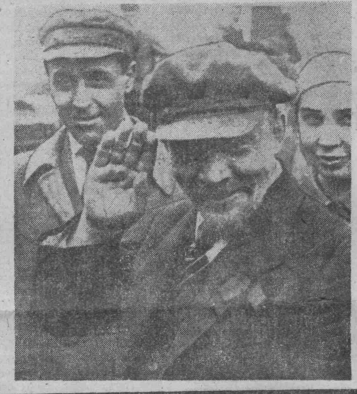
бе писали пионеры Н. К. Крупской.

Как лучшему другу Ильича, жене, товарищу по борь-