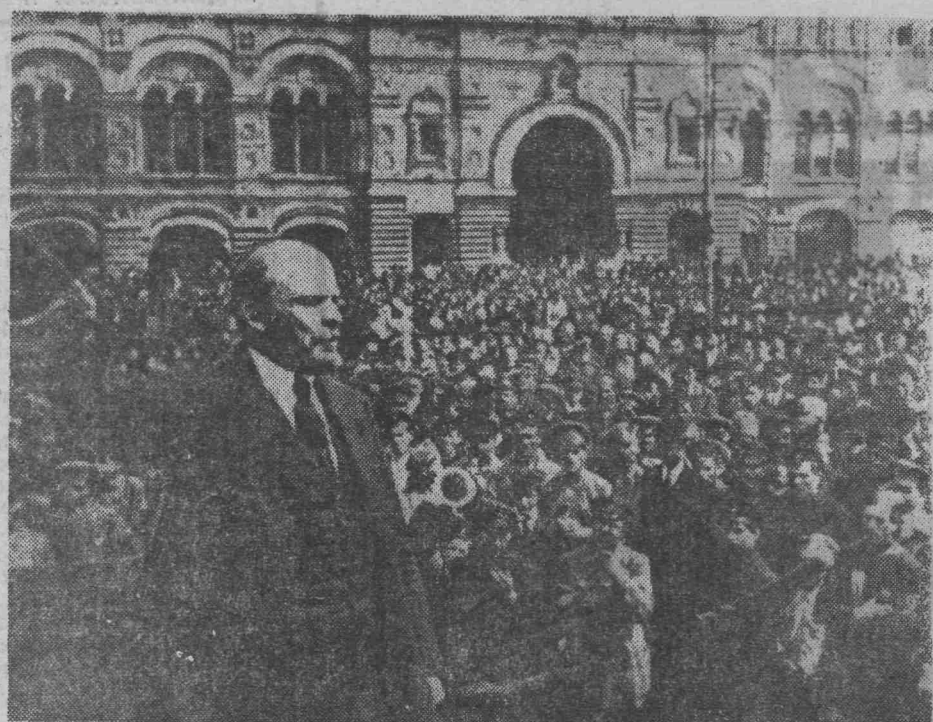
● В. И. Ленин произносит речь на Красной площади перед войсками Всевобуча. Москва. 25 мая 1919 года.