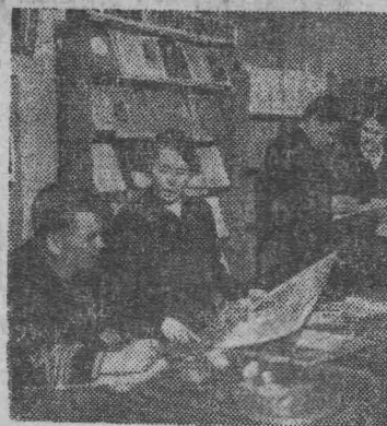
КОМИ АССР. Большую помощь пропагандистам и слушателям школ, кружков и се-

минаров оказывают работники кабинета политпросвещения Печорского горкома КПСС. Им оформлены книжные выставки, включающие работы В. И. Ленина; систематически выпускается бюллетень о книжных новинках. Подготовлены обзоры «В. И. Ленин в воспоминаниях современников», «В. И. Ленин в советской поэзии» и другие.