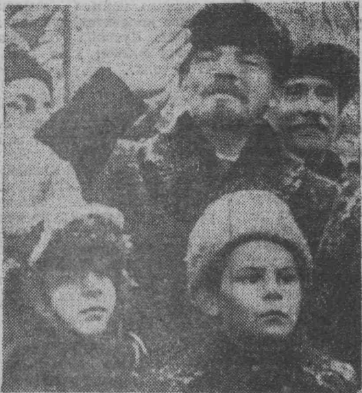
В. И. Ленин на Красной площади во время празднования второй годовщины Великой Октябрьской социалистической революции. Москва, 7 ноября 1919 года.