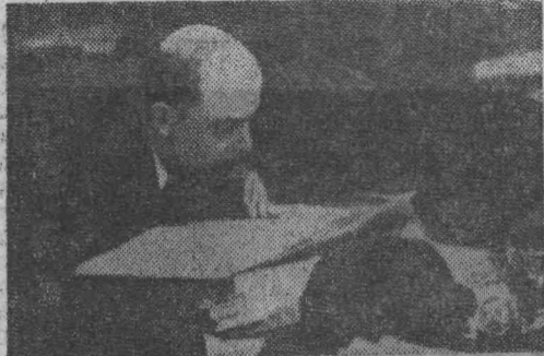
На снимке: В. И. Ленин в президиуме IX съезда РКП(б) в Свердловском зале Кремля. Москва, март-апрель 1920 года.