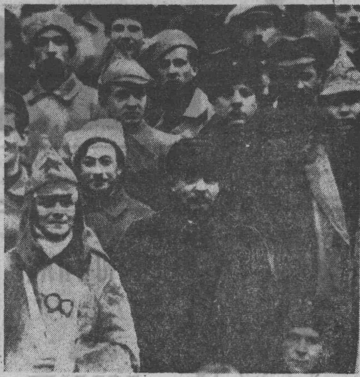
В. И. Ленин и К. Е. Ворошилов в группе делегатов X съезда РКП(б) — участников подавления Кронштадтского мятежа. Москва, март 1921 года.