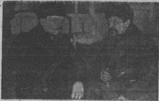
На снимке: В. И. Ленин и М. И. Калинин в Доме союзов во время работы I Всероссийского съезда трудовых казаков. Москва, 1 марта 1920 года.