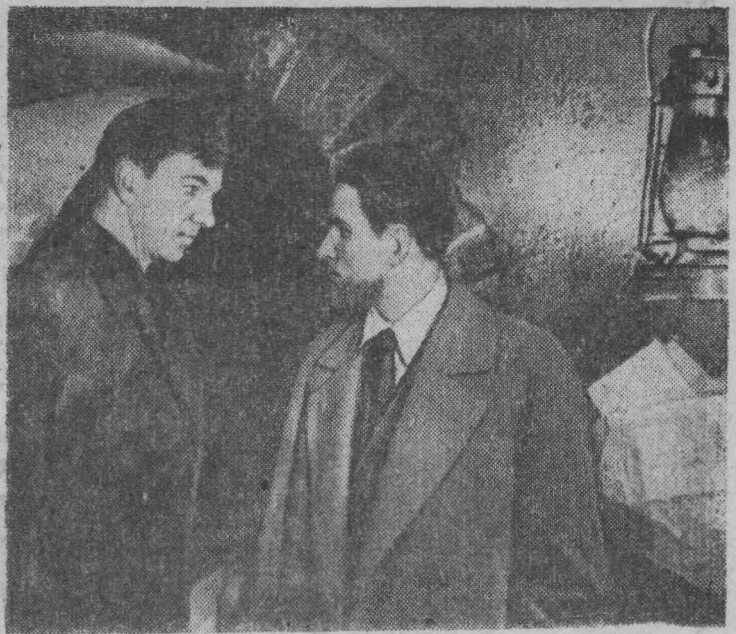
БЕЛОРУССКАЯ ССР. На киностудии «Беларусьфильм» начались съемки многосерийного телевизионного фильма «Руины стреляют...» по книге белорусского журналиста Ивана Новикова.

Фильм расскажет о героической борьбе минских подпольщиков против фашистских захватчиков.