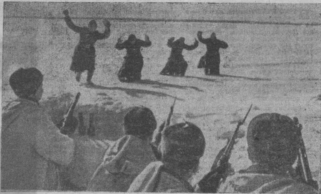
1941 год. Западный фронт. Гитлеровские солдаты сдаются в плен советскому боевому охранению.