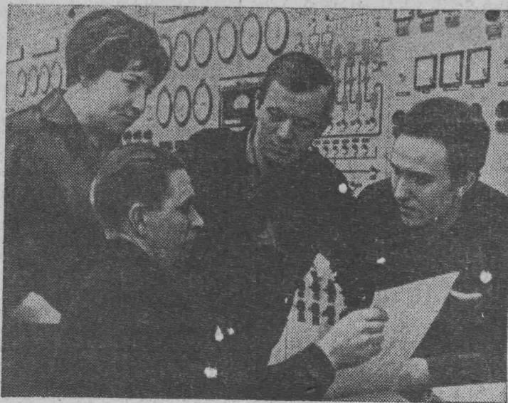
ТУЛЬСКАЯ ОБЛАСТЬ. Высокую оценку получила работа коллектива Щекинского химиче-

ского комбината. Щекинцы усовершенствовали структуру управления производством, массо-