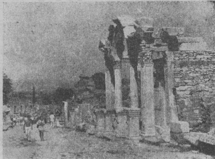
Развалины древнего Эфеса — одна из достопримечательностей Турции. Две тысячи лет назад это был один из крупнейших портов на Эгейском море. Века покрыли некогда цветущий город слоем земли, а море отодвинуло его на многие километры.

Раскопками, ведущимися с начала XX века, обнаружены многочисленные строения античного города.