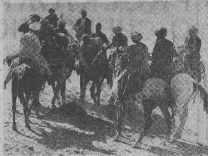
АФГАНИСТАН. Во время национальной игры «Боз-кяши» («Отними козла»). Эта игра широко распространена в северных провинциях страны.