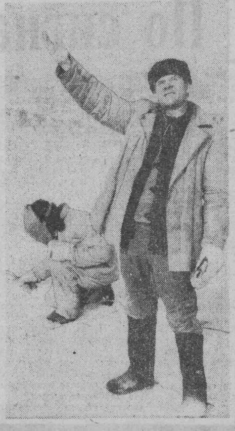
Фото и текст Г. БУСЫГИНА

И хочется верить, что они пойдут в ногу с генеральным подрядчиком и сделают все возможное, чтобы сдать в срок спортивный богатырь, который украсит наш город.