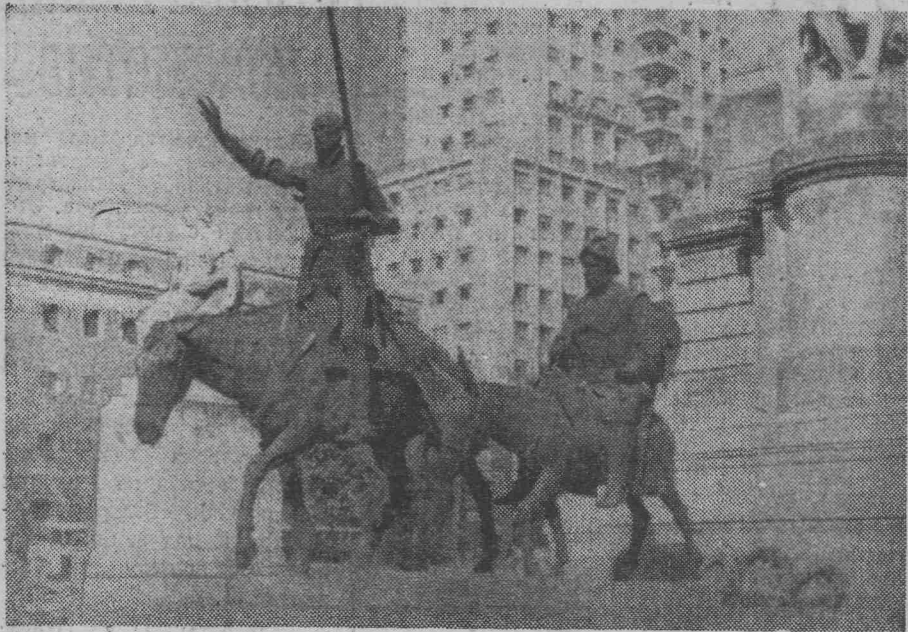
МАДРИД. Памятник Дон Кихоту и его верному оруженосцу Санчо Панса на площади Испании.