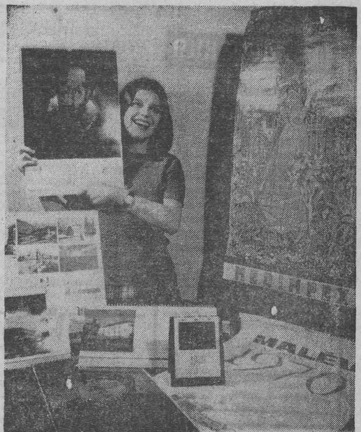
Календари 60 видов выпущены в Венгрии в наступающем году. Общий тираж художественно оформленных изданий, пользующихся признанием за рубежом, составит полмиллиона экземпляров. На международном конкурсе 1969 года, в котором приняла участие 54 страны, красивая венгерская коллекция была удостоена серебряной медали.