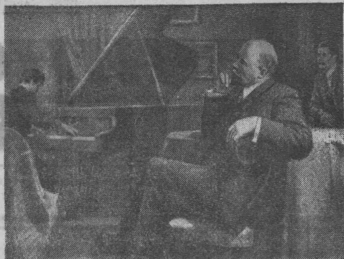
МОСКВА. Свыше четырех тысяч произведений живописи, скульптуры, графики экспонируется в Центральном выставочном зале на четвертой республиканской художественной выставке «Советская Россия», посвященной 100-летию со дня рождения В. И. Ленина.

На снимке: картина П. Белоусова «В минуту отдыха» (Ленинград).