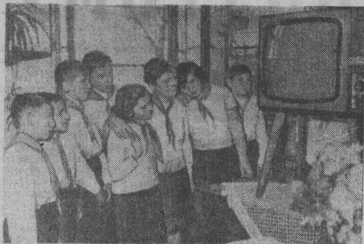
На снимках: это 1000-й телевизор, подаренный венгерским школьникам. Его купила для ребят сельской школы области Чонград редакция газеты «Непсава» — центрального органа профсоюзов.

«Каждой школе — телевизор!» — так называется движение, развернувшееся в Венгерской Народной Республике. Шестой год телевидение страны успешно проводит передачи для учащихся. Однако не все школы имели возможность или пользоваться. Телевизоры отсутствовали там, где они больше всего нужны, — в селах.