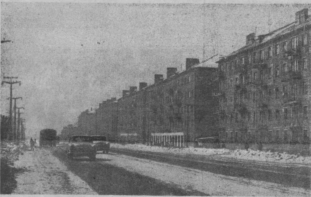
Ленинск-Кузнецкий — сегодня