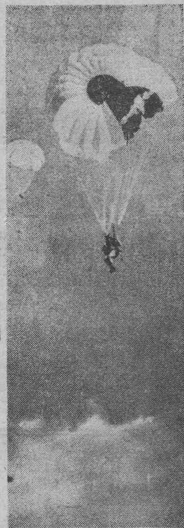
Нам, парашютистам, привольно в небе чистом...

Видный крестьянский деятель Джитен Гхош сказал, выступая на митинге, что только социализм может избавить человека от эксплуатации. «В разработке идей, приведших к победе социализма в России, главная роль принадлежит Ленину», подчеркнул он. Его призыв к свободе, равноправию и миру — основное условие прогресса и процветания развивающихся стран».