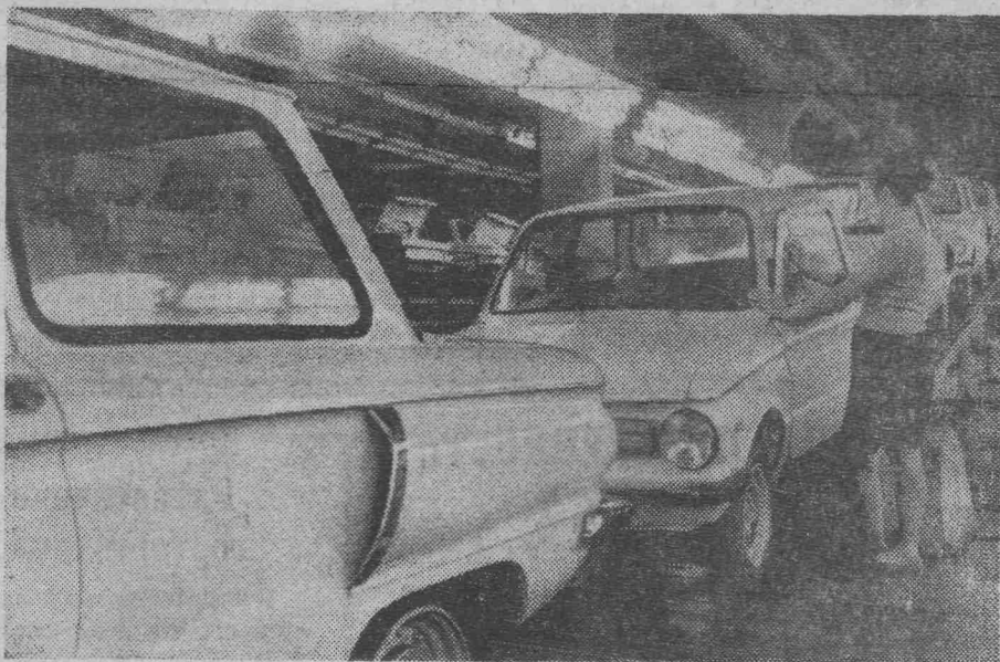
Ритмично работает коллектив сборочного цеха заповорожского автозавода «Коммунар». В 1969 году с главного конвейера предприятия сошло более 500 «Запорожцев» сверх плана. На снимке: слесарь-сборщик комсомолка Галина Вегера подготавливает автомобили «Запорожец» модели «ЗАЗ-966» к отправке.