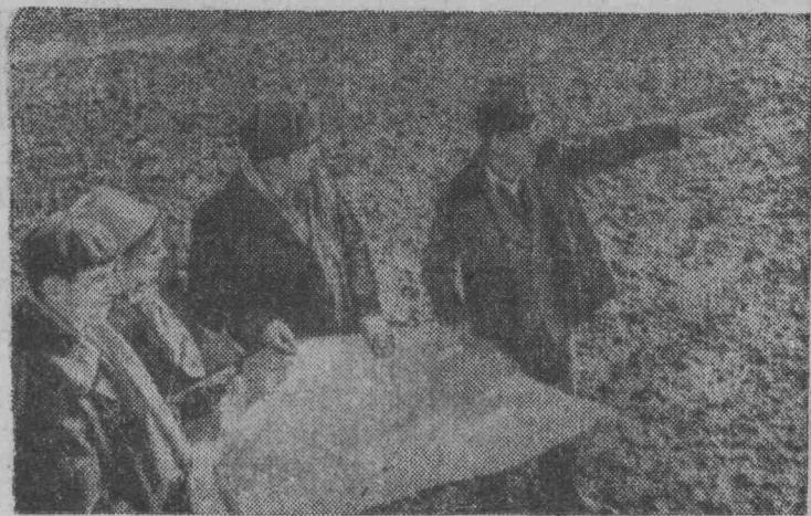
к весенне-полевым работам. На снимке: члены правления обсуждают дальнейшее расширение оросительной системы.