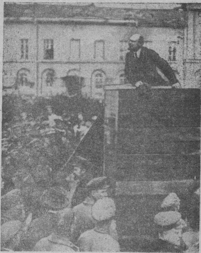
В. И. Ленин выступает с речью на площади Свердлова на параде войск, отправляющихся на польский фронт. 1920 год, 5 мая. Москва.