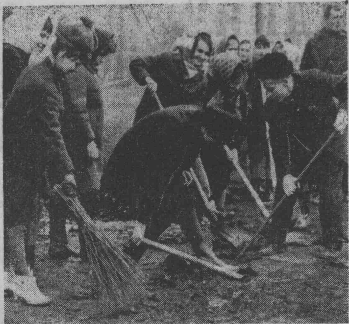
на этом снимке, читатель, вы видите, как учащиеся горного техникума «штурмуют» грязь и мусор на улице Энгельса.