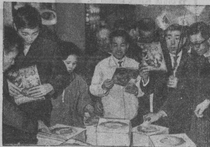
ОСАКА. Всемирная выставка «ЭКСПО-70». На снимке: в павильоне СССР. Литература о Советском Союзе привлекает внимание посетителей.