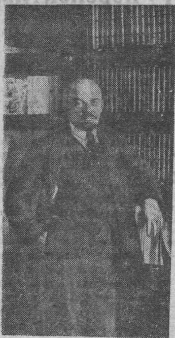
В. И. ЛЕНИН у книжного шкафа в своем кабинете в Кремле. Москва, 16 октября 1918 года.

(Архив Института марксизма-ленинизма при ЦК КПСС).