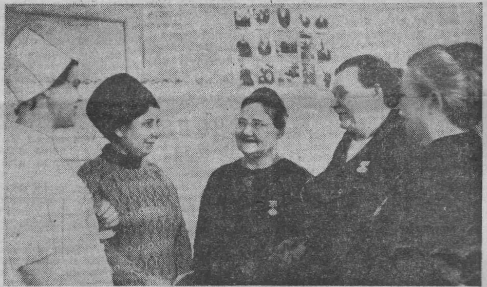
13 апреля в поликлинике № 1 состоялось торжественное собрание, посвященное 100-летию со дня рождения В. И. Ленина.