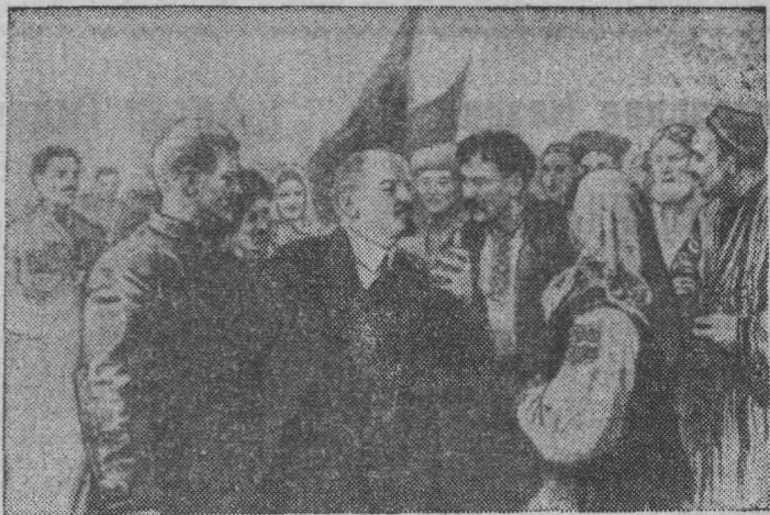
«В. И. Ленин—вдохновитель дружбы народов». Художник А. Резниченко.