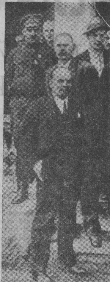
В. И. Ленин, А. М. Горький в группе делегатов II конгресса Коминтерна у дворца Урицкого (Таврический дворец).

К 100-летию со дня рождения В. И. Ленина вышло в свет четвертое издание книги «В. И. Ленин. Биография». По сравнению с предыдущими юбилейное издание полнее учитывает архивные материалы, мемуары и обширную литературу о Ленине. В этом издании более обстоятельно освещены ленинские идеи по актуальным проблемам, приведены новые факты о жизни и деятельности Владимира Ильича Ленина. (ТАСС)