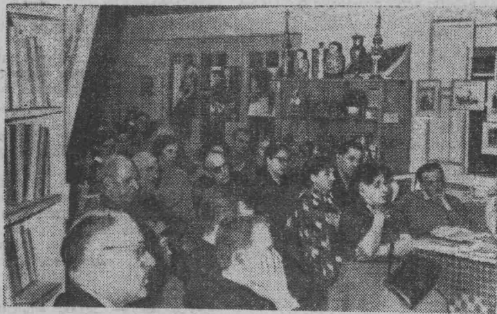
В Швейцарии проходят торжественные собрания и встречи, посвященные 100-летию со дня рождения В. И. Ленина. Такие собрания уже состоялись в Базеле, Локарно, Женеве, Цюрихе и других городах страны. На снимке: во время юбилейного вечера в Лозанне.