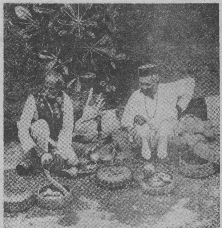
ИНДИЯ. Заклинатели змей. Это древнее искусство по-прежнему пользуется большим успехом, особенно у туристов.