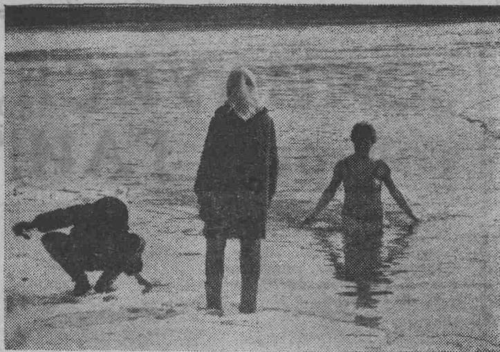
НАША МАМА — МОРЖ.