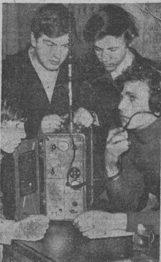
При штабе гражданской обороны шахты «Полысаевская-2» в военно-учебном пункте юноши до призыва в Советскую Армию проходят курс молодого бойца. Они знакомятся с Уставами Вооруженных Сил СССР, изучают стрелковое оружие, радио- и телефонную