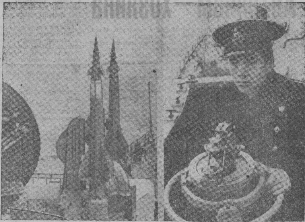
На снимках: слева — ракеты смотрят в небо.

За справками обращаться: горисполком, отдел трудовых ресурсов.