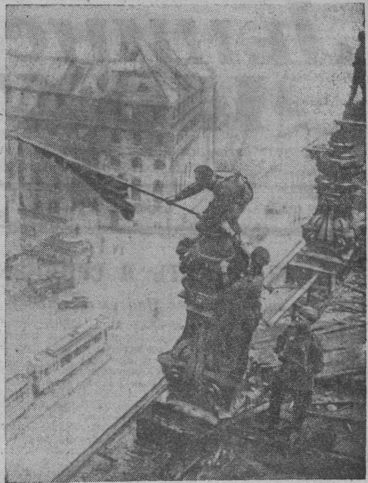
1945 год. Советский флаг над рейхстагом в Берлине.