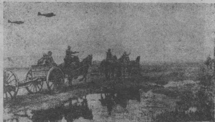
Северо-западный фронт. 1942 год. Вперед на Запад!