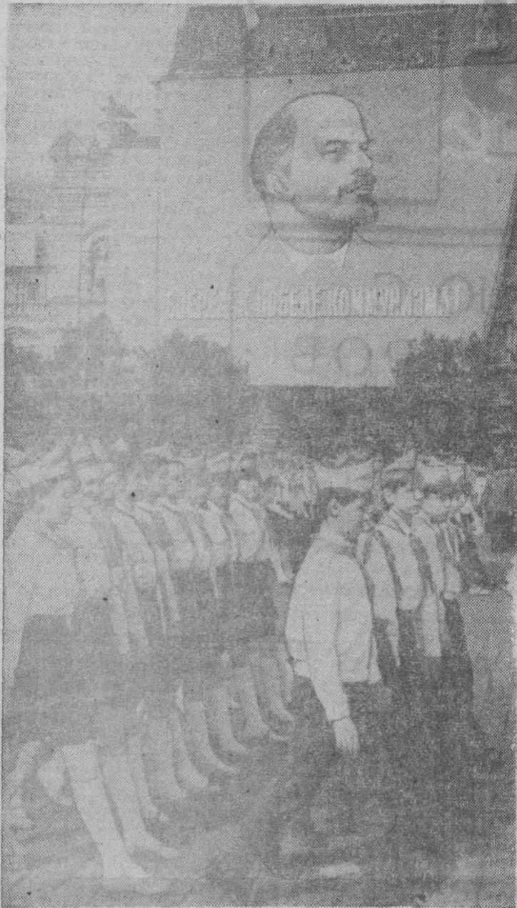
На снимке: парад юных ленинцев на Красной площади в Москве.