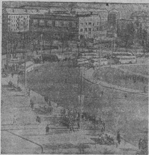
КАЛИНИНГРАД сегодня. Театральная улица.